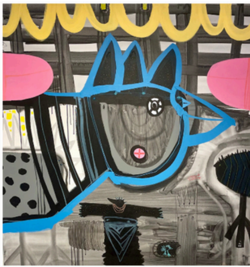
Per Buk 8.2.-1.3.